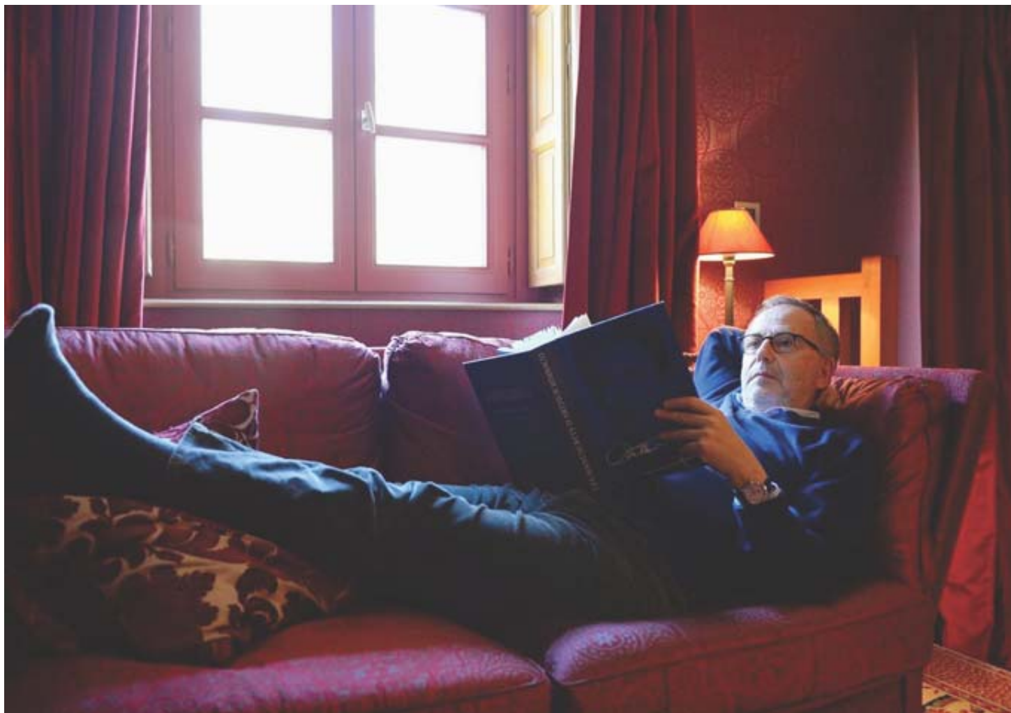
C'est dans le silence apaisant de sa maison de Touraine que Fabrice Luchini aime chercher (et trouver) la musicalité de la langue française qu'il restitue sur les scènes de théâtre.